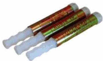
Feux à mains

Les dispositifs pyrotechniques obligatoires dans les navires de plaisance représentent un danger lors de leur mise au rebut, lorsqu'ils ne sont pas éliminés via la filière adaptée. En effet, ils ont été responsables de plusieurs départs de feux aux conséquences importantes sur le Centre d'Enfouissement d'Espira de l'Agly et l'usine d'incinération de Calce. Une fois arrivés sur ces centres de traitement, et sous l'effet d'un broyeur ou de la compression des engins de terrassement, ils se sont déclenchés et ont engendré des incendies. Ce fût le cas à plusieurs reprises dans le département des Pyrénées-Orientales, pouvant aller jusqu'au blocage complet de la chaîne globale de gestion des déchets. En 2013, devant l'absence de système de récupération agréé et face aux enjeux importants que représente la sauvegarde de nos outils départementaux de transport et de traitement des ordures ménagères et assimilées, le SYDETOM 66, a délibéré pour agir au plus près des plaisanciers et tenter de capter ce gisement.