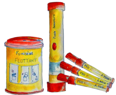
Feux de détresse