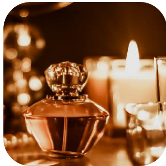
Distribution & Luxe