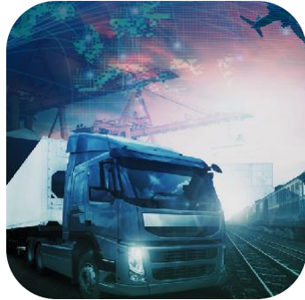
Transport & Logistique