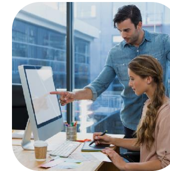
Service & Conseil