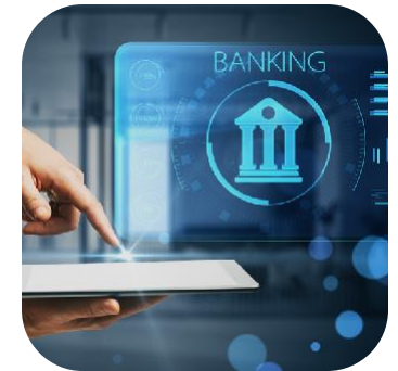
Banque / Assurance Services Financiers