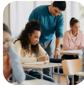
Public & Économie Sociale Solidaire