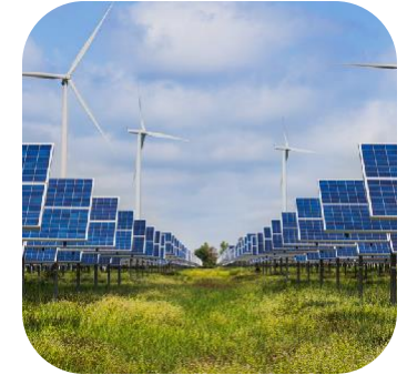
Energie & Environnement